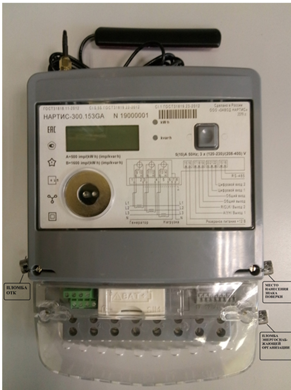
Рисунок 1 – Общий вид счетчика с внешней антенной, предназначенного для использования в закрытых помещениях, мест пломбировки, мест нанесения знака утверждения типа, знака поверки, заводского номера.

Общий вид счетчиков, мест пломбировки, мест нанесения знака утверждения типа, знака поверки, заводского номера приведены на рисунках 1 и 2.