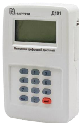
е) выносной цифровой дисплей НАРТИС-Д101