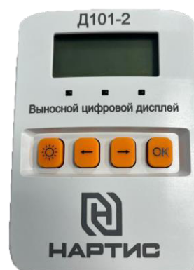
ж) выносной цифровой дисплей НАРТИС-Д101-2