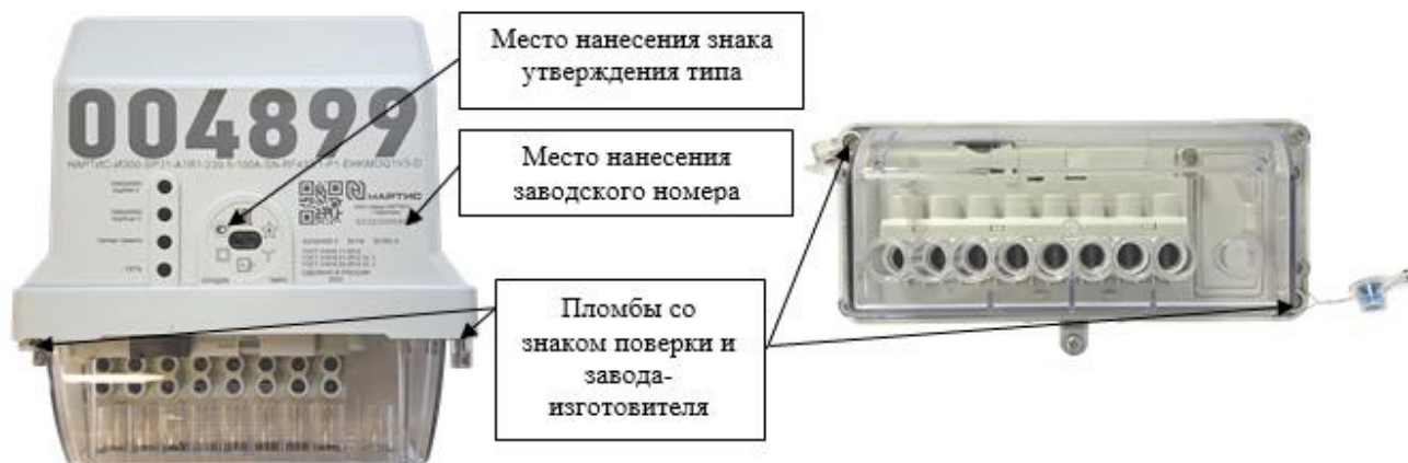
в) блок измерительный счетчиков с типом корпуса SP31