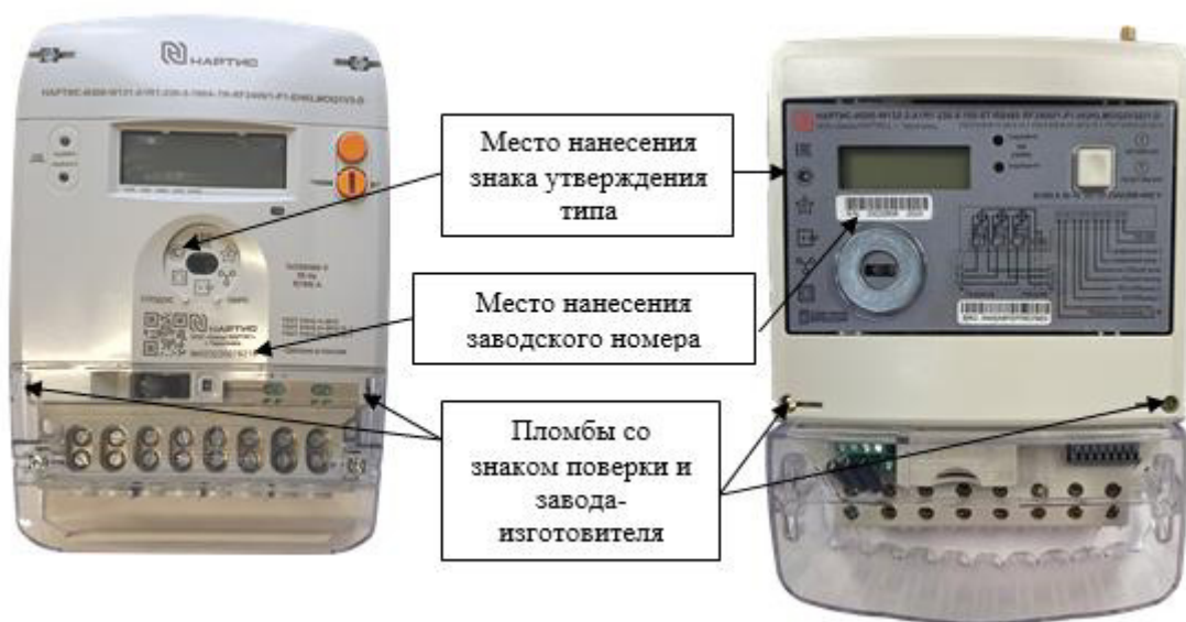
а) счетчики с типом корпуса W131